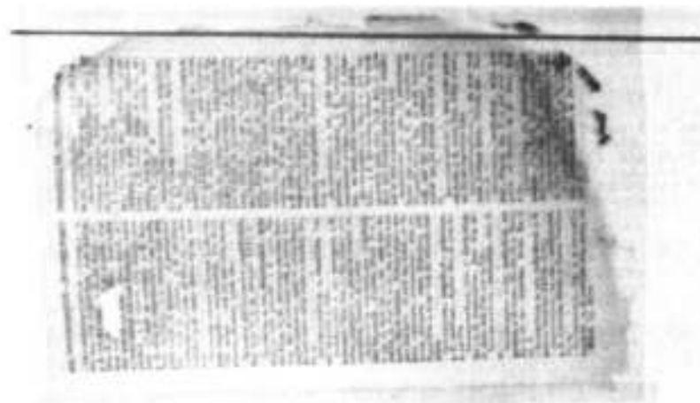
nach der Imprägnierung mit Glib tamul-T gebleicht